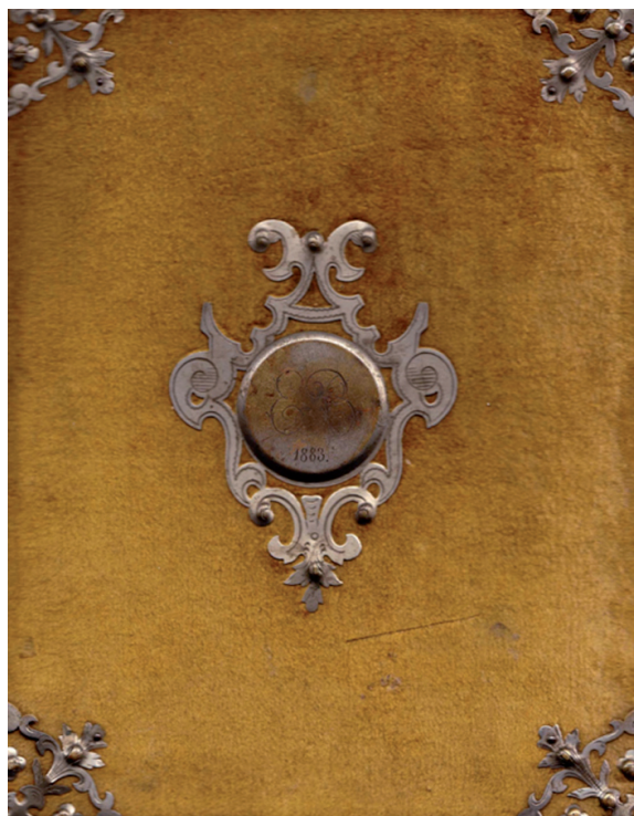
Ryc. 7. Okładka albumu rodzinnego – prezentu dla matki Józefa Kostrzewskiego Elżbiety na jej ślub ze Stanisławem Kostrzewskim w r. 1883. Ze zb. PANAWOP, Materiały Józefa Kostrzewskiego, sygn. P.III-51

Liczne są fotografie, m.in.: z okresu dzieciństwa, nauki w gimnazjum i na studiach, fotografie wykonane z okazji jubileuszy i uroczystości, na konferencjach i sesjach naukowych. Grupę tę zamyka zestaw dokumentów dotyczących stanu zdrowia, nekrologi, kondolencje od osób i instytucji oraz materiały dotyczące uroczystości pogrzebowej.